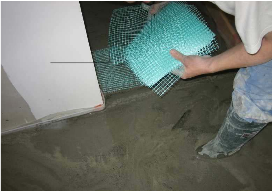
Figure 1 - Disposition des renforts